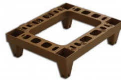
Pieds plastiques Nico