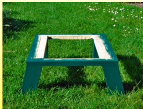
Mes pieds fabriqués maison