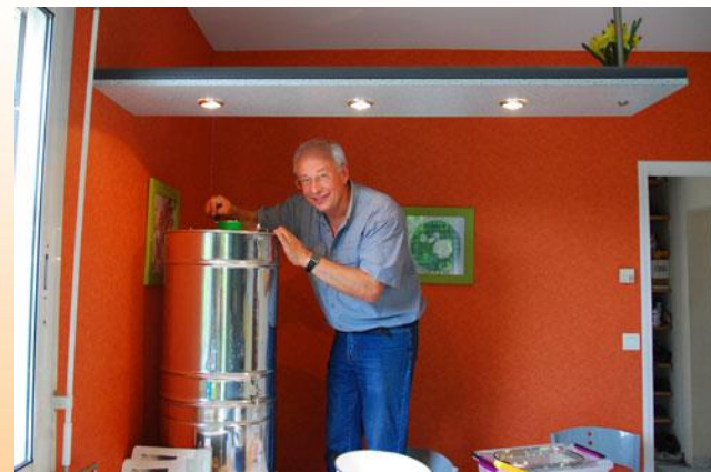
Ma première récolte en 2011

Retirer cette petite couche à passant un linge humide en surface, avant la mise en pot