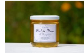
Pot de 250 gr

(Autres conditionnements 125 g, 50g ...sur demande)