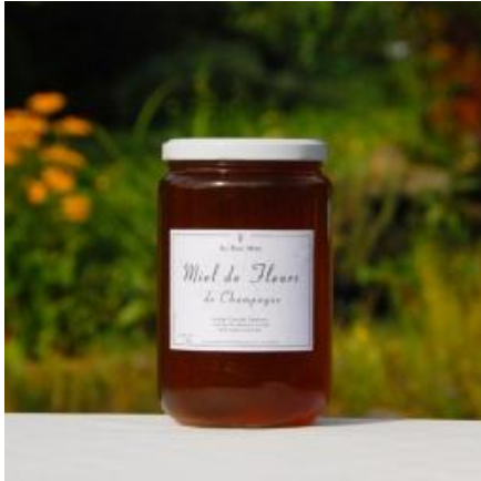
Pot de 1 kg