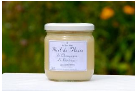
Pot de 500 gr